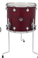
1 x Floor tom 16 (avec Remo Ambassador)