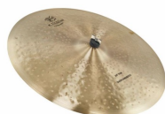
1 x 22"-20" Zildjian K Constantinople Ride (ou Similaire)