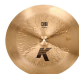
1 x 20"-18" Zildjian K China