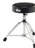
1 x Tabouret Batterie Roc&soc, Dw ou Pearl