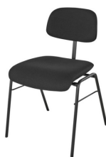
6 x chaises confortables et sans accoudoirs