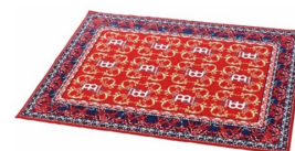
1 x Moquette 3x2m aprox