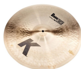
1 x 19" Zildjian K Thin Dark Crash