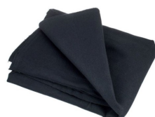
5 x petites tables (ou flighcase) 60 x 40 x 30cm recouvert d'un tissu noir