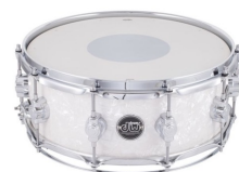
1 x 1 X Caisse Claire en bois 14x5" (avec Remo Ambassador)