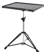
2 x Table Percussion PEARL (ou similaire)